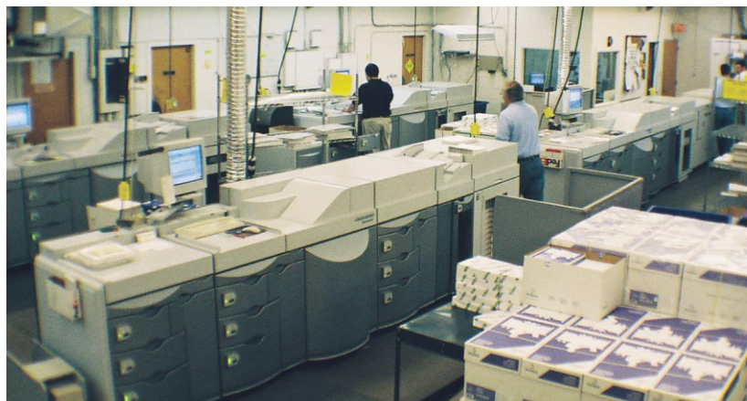
5つのKodak Digimasterシステムを駆使するKen Cook社は、年間数億ページもの生産実績をあげています。